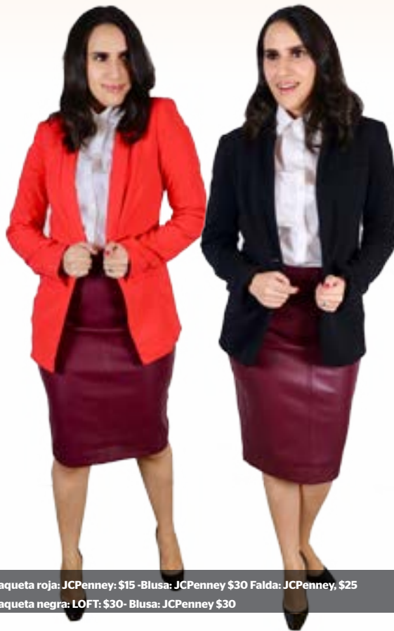
Chaqueta roja: JCPenney: $15 - Blusa: JCPenney $30 Falda: JCPenney, $25 Chaqueta negra: LOFT: $30- Blusa: JCPenney $30