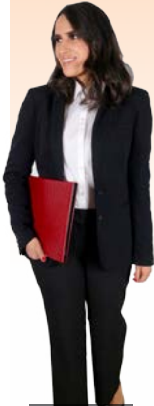
Chaqueta y pantalón: LOFT $65/ Blusa: Worthington en JCPenney $30.

Asegúrate de que la ropa no te reste puntos con tu posible jefe